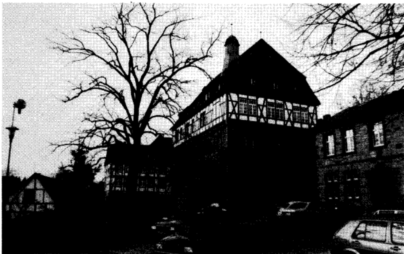
Rathaus mit "Friedenslinde"

Nur einen Steinwurf weit entfernt ist das ehemalige Dominikanerkloster, das heute eine Schule beherbergt. Die Übergabe der Kirche, die