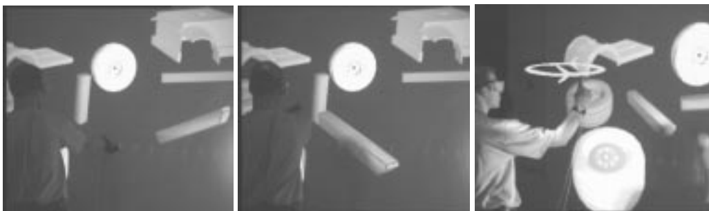
Abbildung 5 Zwei multimodale Interaktionsbeispiele. Linkes und mittleres Bild: „Nimm [Zeigegeste] dieses Rohr und verbinde es mit [Zeigegeste] dem Teil“. Rechtes Beispiel: „Und nun drehe es so [Start mimetische Geste] herum [Ende mimetische Geste]“.

Ruhepunkte, hohe Beschleunigungen, Symmetrien und Abweichungen von Ruhestellungen bei Handspannung und der Handposition. Realisiert wurden bislang Erkener für die universellen Basisinteraktionen (Pointing, Grasp, GraspRelease, Rotation, Translation). Bei der sprachlich-gestischen Interaktion werden bislang drei Typen kommunikativer Gesten ausgewertet: Deiktische Gesten ("nimm <Zeigegeste> dieses Teil") spezifizieren ein Objekt oder einen Ort der virtuellen Umgebung, mimetische Gesten ("drehe es <kreisender Zeigefinger> so herum") qualifizieren die Ausführung einer Aktion, und ikonische Gesten ("das so <Andeutung eines Zylinders durch die Handform> geformte Objekt ...") werden zur Objektreferenz verwendet. Zwei dieser Beispielinteraktionen werden in Abbildung 5 veranschaulicht.