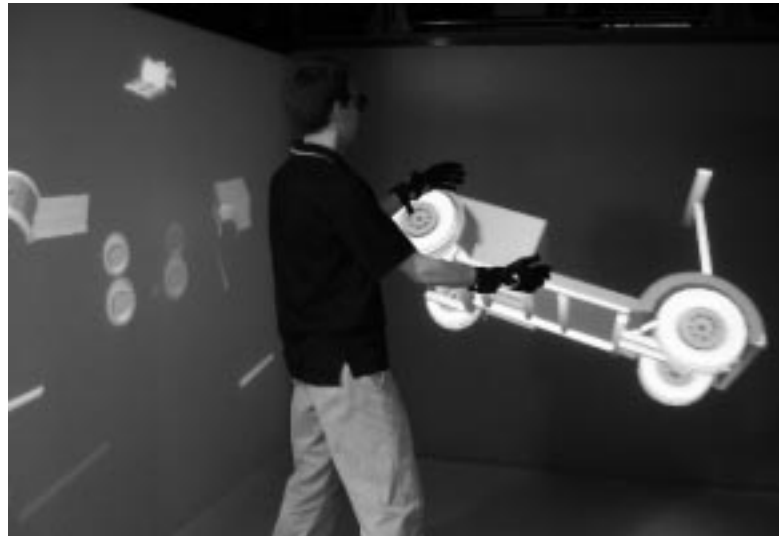
Abbildung 1: Im Projekt „virtuelle Werkstatt“ soll die Konstruktion und Evaluation von Citymobil-Varianten in einer Cave-artigen VR-Installation ermöglicht werden.

Demonstratorsystem Besonderheiten der Virtuellen Realität wie 1:1-Darstellung, visuell-auditive Präsentation und Immersion ausgenutzt.