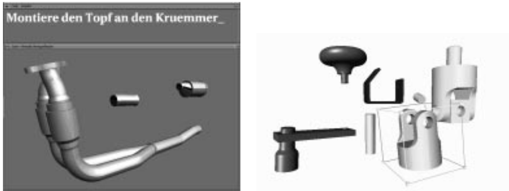
Abbildung 2: Zusammenbau CAD-basierter Bauteile mit dem Virtuellen Konstrukteur: Links wird die Abgasanlage eines Automobils mittels sprachlicher Instruktionen zusammengesetzt (IGES-Datensatz der Volkswagen AG). Rechts wird das aus dem CAD-System "Solidworks" importierte "Universal Joint" (Kreuzgelenk) mittels direkter Manipulation gebaut.

verbundenes, unter Linux betriebenes Clustersystem der Firma Artabel. Dieses besteht aus insgesamt 6 Doppelprozessor-Compute-Servern und 8 synchronisierten Render-Nodes (mit NVidia Grafik) auf Basis von PC Technologien. Die Verteilung der Graphikprimitive auf die Render-Nodes erfolgt dabei über einen speziellen OpenGL Layer, welcher mittels eines sort-first Ansatzes die zu den einzelnen Views (hier den Projektionsseiten) zu schickenden Primitive bestimmt und diese anschließend über das Myrinet an die entsprechenden Render-Nodes versendet.