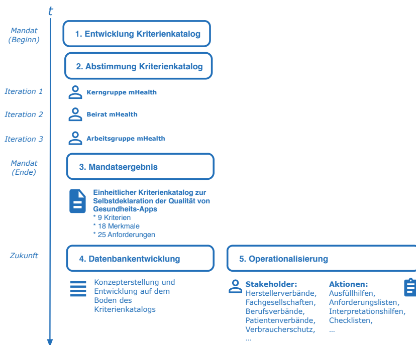
Abbildung 1: Ablauf und strategische Planung