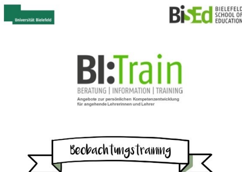
Abbildung 1: Der Beginn des Lernvideos zur Methode Beobachtung

Das Lernvideo steht als Online-Supplement dieses Beitrags zum Download zur Verfügung.