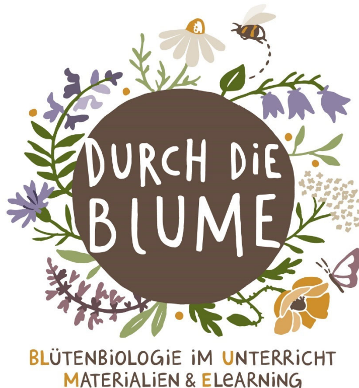
Abbildung 1 Logo des Projekts „Durch die BLUME“ der AG Didaktik der Biologie an der Johannes Gutenberg-Universität Mainz. Das Logo wurde von Inka Vigh gestaltet ( www.inkavigh.de )

„Durch die BLUME: Blütenbiologie im Unterricht Materialien und E-Learning“ (Logo siehe Abbildung 1) ist ein biologiedidaktisches Forschungs- und Entwicklungsprojekt innerhalb dessen Konzepte und Materialien rund um die Themen Blütenbiologie und -vielfalt entstehen. Die originale Begegnung sowie die praktische und intensive Auseinandersetzung mit Pflanzen stehen dabei stets im Vordergrund. Mithilfe eines Netzwerks von Schulen aus Rheinland-Pfalz und Hessen werden die Materialien erprobt, evaluiert, weiterentwickelt und anschließend Lehrerinnen und Lehrern für den Einsatz im Biologie- und Nawi-Unterricht verfügbar gemacht.