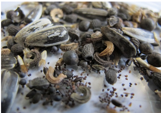
Abbildung 5 Saatgut der didaktischen BLUMEnmischung.

Die didaktische BLUMEnmischung fördert die Anwendung vieler fachgemäßer Arbeitsweisen im Unterricht, wie z. B. den Umgang mit binären Bestimmungsschlüsseln, die Verwendung von Stereomikroskopen, die Durchführung von Langzeitbeobachtungen sowie das Messen, Auswerten und die graphische Darstellung von Wachstum.