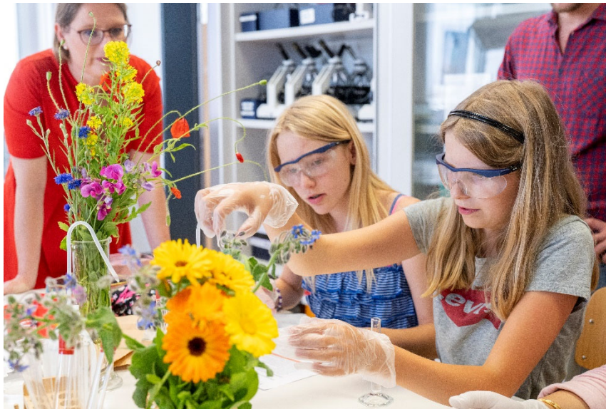
Abbildung 7 Dr. Stefanie Hubig (Bildungsministerin Rheinland-Pfalz) beobachtet Schülerinnen bei der Extraktion und Auftrennung von Blütenfarbstoffen.

Alle wichtigen Informationen zu den Experimenten und Untersuchungen erhalten die Schülerinnen und Schüler über separate Arbeitsblätter. Eine zentrale Rolle spielt das Fotografieren der Versuchsergebnisse sowie der Präparate unter dem Mikroskop. Dies ist mit den meisten Handykameras problemlos möglich. Es entstehen oft eindrucksvolle Bilder, deren Ausstellung sich lohnt! So werden bei einer Postersession am Ende die vielfältigen Ausprägungen der pflanzlichen Strukturen bei verschiedenen Arten erst richtig deutlich.