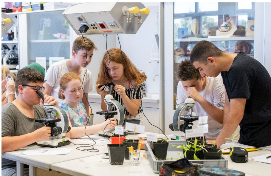
Abbildung 6 Schülerinnen und Schüler mikroskopieren die Wurzelhaare ihrer Pflanzen.

Als Aufbaumodul zur didaktischen BLUMEnmischung können mit dem BLUMEn-Labor anatomische Untersuchungen sowie biochemische und physiologische Experimente durchgeführt werden. Das BLUMEn-Labor umfasst Versuche zu den fünf wichtigsten Grundorganen der Samenpflanzen. So werden die Wurzeln junger Pflanzen per Schattenriss abgezeichnet, um den Grundaufbau von Wurzeln nachvollziehen zu können und Wurzelhaare an feinen Seitenwurzeln unter dem Mikroskop untersucht (siehe Abbildung 6). Weiterhin werden Sprossachsenquerschnitte gemacht und angefärbt, sodass verholzte und unverholzte Strukturen zum Vorschein kommen. Mithilfe einfacher Blattabdrücke können Stomata auf Blattober- und -unterseite mikroskopiert und ausgezählt werden. Zur Blütezeit werden Blütenfarbstoffe extrahiert und in zwei Phasen, eine hydrophile und eine lipophile Phase, aufgetrennt (siehe Abbildung 7). Zudem wird die Auswirkung von Frost auf die Keimungsfähigkeit von trockenen und zuvor gequollenen Samen getestet.