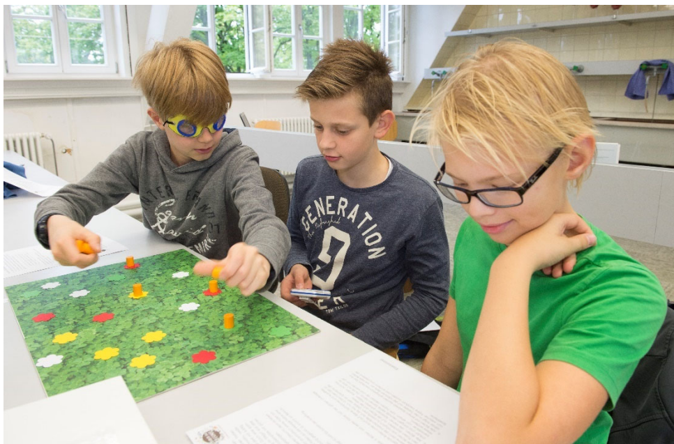
Abbildung 6 Schüler schlüpfen in die Rolle eines Bestäubers und simulieren natürliche Selektion.

In Schulbüchern wird Evolution meist an zoologischen oder anthropologischen Beispielen erläutert. Aber auch die Pflanzen bieten gute Ansatzpunkte, um die Entstehung von Vielfalt und den zugrunde liegenden Evolutionsfaktoren zu veranschaulichen. Ein Beispiel bietet eine Simulation zur natürlichen Selektion, die innerhalb des Durch die BLUME -Projekts entstanden ist. Ein Spielbrett bzw. Bastelbogen, auf dem eine Kleewiese abgebildet ist, bildet die Basis des Spiels. Darauf werden mit einem Motivstanzer ausgestanzte Papierblüten in Rot, Gelb, Weiß und Grün verteilt. Ein Simulationsset wird von 2-3 Schülerinnen und Schülern bespielt. Ein Schüler oder eine Schülerin nimmt die Rolle eines bestäubenden Insekts ein und zieht eine Facettenaugen-Brille auf, die das fokussierte Sehen erschwert (es kann auch ein einfaches „Fliegenauge“ verwendet werden). Er oder sie ist nun aufgefordert, innerhalb von 15 Sekunden Pollen in Form von Spielsteinen auf den Blüten zu verteilen. Ein anderer Spieler stoppt die Zeit (siehe Abbildung 8).