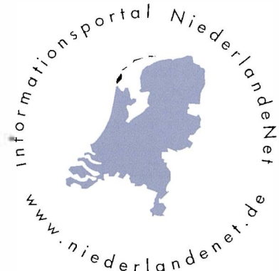
Das erste NiederlandeNet-Logo

Zu Beginn des Projektes war es das Ziel, Basisinformationen zu den Niederlanden im Allgemeinen und weiterführende Informationen zu längerfristigen gesellschaftlichen Diskussion im Besonderen einem breiten Nutzerkreis zur Verfügung zu stellen. Im Laufe der Jahre kamen neue Inhalte hinzu, wodurch die Website immer weiter anwuchs. An Bedeutung gewann vor allem die Nachrichtenrubrik mit Berichten zu aktuellen Geschehnissen in den Niederlanden oder den deutsch-niederländischen Beziehungen, die mit der Zeit immer zahlreicher wurden. Aktuell geben durchschnittlich viermal wöchentlich kurze deutschsprachige Meldungen Einblick in politische, gesellschaftliche, kulturelle und wirtschaftliche Entwicklungen aus dem Nachbarland. Mit der Erweiterung der Inhalte erhöhten sich auch die Zugriffszahlen: Im Jahresbericht für das Jahr 2005 wurde noch stolz von durchschnittlich 2.000 Nutzern beziehungsweise 12.000 Klicks pro Monat berichtet. Anno 2015 verzeichnet das Portal pro Monat durchaus Zugriffszahlen von bis zu 60.000 Klicks pro Monat. Aktuell stellt NiederlandeNet auf mehreren tausend Seiten mit aktuellen Nachrichten, Hintergrundinformationen und Servicetipps ein umfassendes und kostenloses Paket an Informationen für ein breit gefächertes Publikum zur Verfügung.