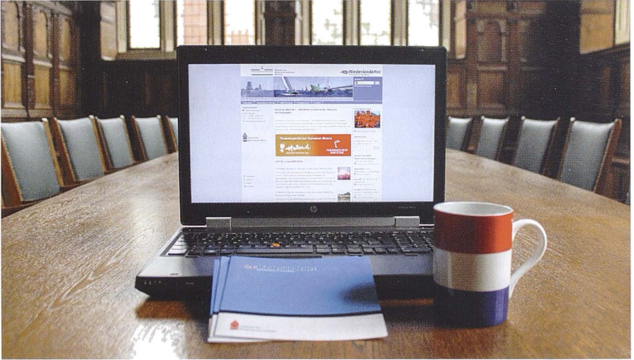
Website im Jahr 2014

Außenministerium, das Ministerium für Wirtschaft, Mittelstand und Energie des Landes Nordrhein-Westfalen und das niedersächsische Ministerium für Wirtschaft, Arbeit und Verkehr.