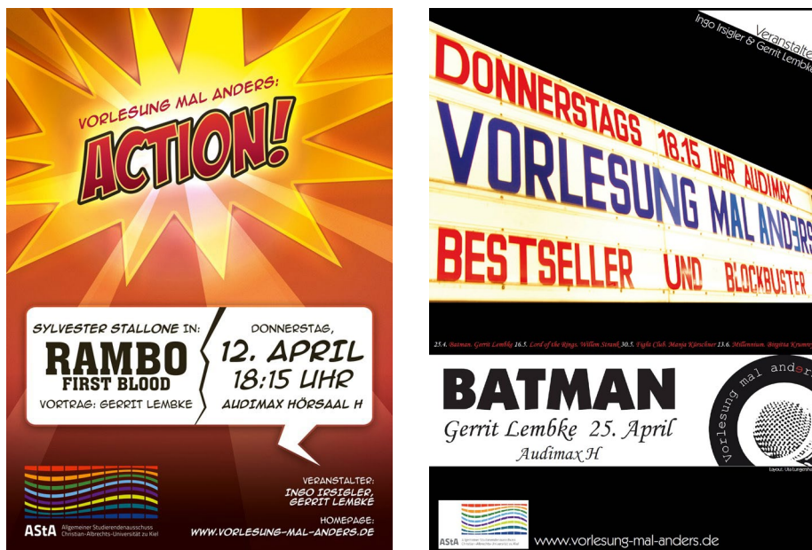
Abb. 4 und 5: Plakate der Vorlesung mal anders .

Zu diesem Zweck haben wir die universitären Informationskanäle genutzt: Unsere Studierendenzeitung Der Albrecht hat regelmäßig über die Veranstaltungen berichtet, 12 und die Zeitschrift des Allgemeinen Studierenden-Ausschusses (AStA) hat die Vorlesungsreihe angekündigt. In Kooperation mit dem AStA haben wir Flyer mit einem selbstverantworteten corporate design in den Mensen der Universität und 150 Plakate auf dem Campus verteilt (vgl. Abbildungen 4 und 5).