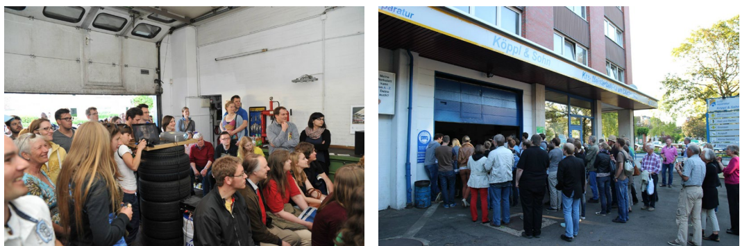
Abb. 14 und 15: Kulturnacht am Blücher in der Autowerkstatt Köppl & Sohn 2013.