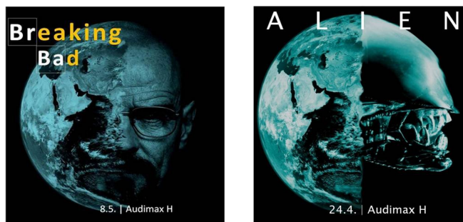
Abb. 10 und 11: Facebook-Veranstaltungsankündigungen der Reihe Parallelwelten .

Zu diesem Zwecke ist die Kombination von bildhafter Sprache und Fachterminologie ebenso zweckmäßig wie der Einsatz von Bildmedien. Dies haben wir nicht nur als bloßes Beiwerk, sondern als integralen Bestandteil des Konzepts verstanden. Schließlich bringen wir unseren Studierenden bei, dass ihre Texte inhaltlich wie auch formal hervor- ragend sein sollten und die Sorgfalt, die sie auf Rechtschreibung, Zeichensetzung, Gram- matik und Formatierung verwenden, ein Abbild der Gründlichkeit ist, mit der sie an den Thesen, Argumenten und Texten gearbeitet haben. So haben wir großen Wert auf visuell ansprechende Materialien und Präsentationen gelegt. Die Poster und Flyer sind von uns selbst entworfen worden, ebenso wie die Facebook-Veranstaltungsankündigungen (vgl. Abbildungen 10 und 11).