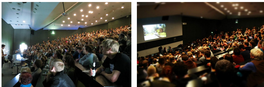
Abb. 8 und 9: Hörsaal der Vorlesung mal anders.

Indem die Administratorenbeiträge einen Appell enthielten, forderten sie zur ersten Auseinandersetzung mit dem Thema und im Idealfall zur Verbreitung des Events bei. Der zentrale Effekt solcher Maßnahmen ist kein informativer gewesen, hingegen schaffte er die nötige Aufmerksamkeit, und dies ist ja nun die Grundbedingung dafür, dass Wissen vermittelt werden kann. Das Ergebnis war eindeutig: Der Vortragssaal war voll, die Zuschauer waren gespannt auf den Vortrag (vgl. Abbildungen 8 und 9). Nun galt es, dass die ZuhörerInnen auch wiederkommen .