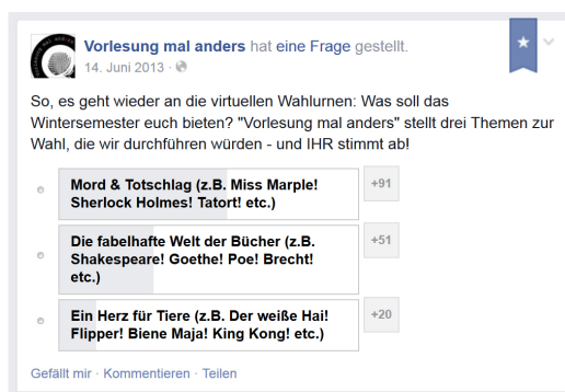
Abb. 3: Online-Abstimmung über das Vorlesungsthema im Wintersemester 2013/14.