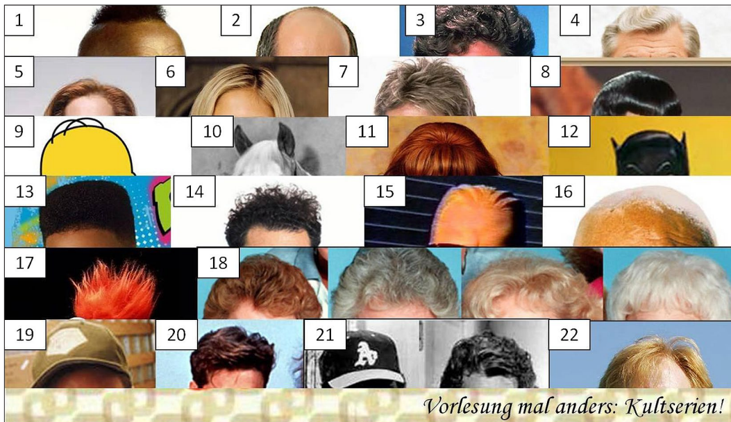
Abb. 7: Kopfkino für Kultserienkenner.

Noch effektiver war die direkte Involvierung der Studierenden durch Umfragen mit inhaltlichem Bezug zum Vorlesungsthema – etwa ob Adam West, George Clooney oder schließlich Christian Bale der ›beste Batman‹ sei, oder ein Rätsel als Einführung in die TV-Serien, in dem es die Köpfe der ProtagonistInnen zu identifizieren galt (vgl. Abbildung 7).