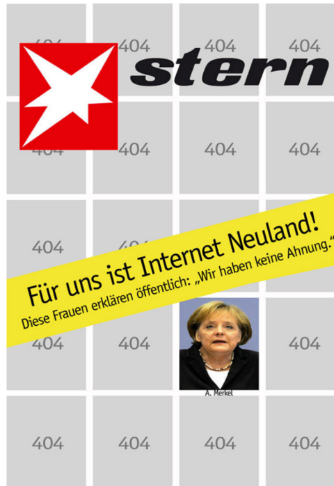
Abb. 1 (oben links): #Neuland-Meme, Stern.de, 19. Juni 2013