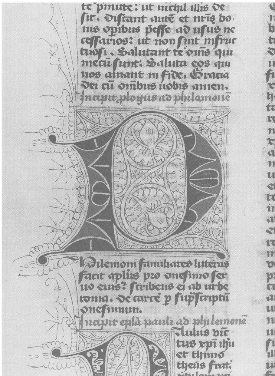
Abb. 13: Berlin, Staatsbibliothek, Ms. theol. lat. fol. 63, Bl. 146v