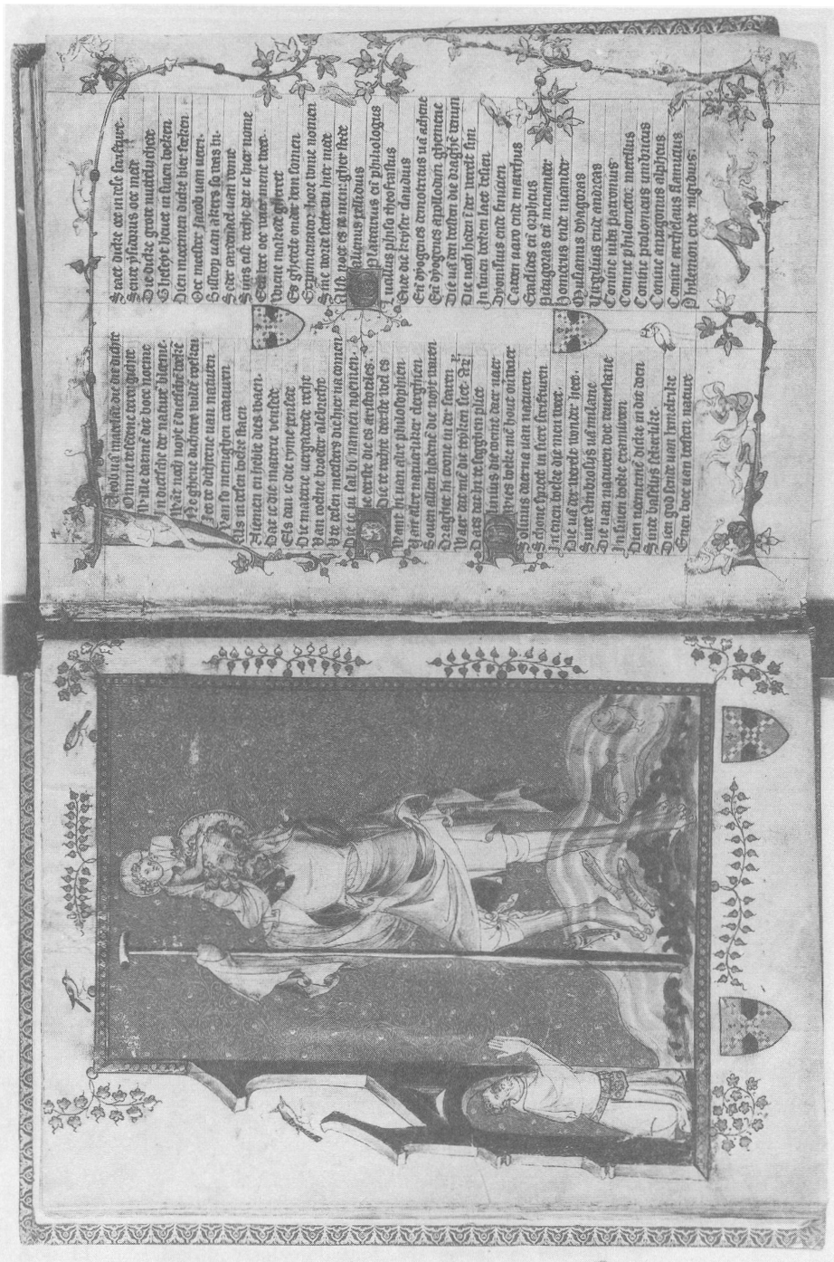
Abb. 6: Leiden, Universitätsbibliothek, B.P.L. 14A, Bl. 25 v - 26 r