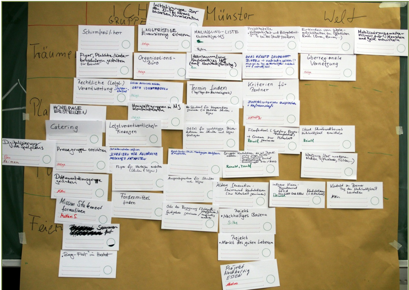
Abbildung 2: Spielplan der Initiative

mehr zu konsumieren, autofrei zu leben und Arbeitsplätze in Wohngebiete zu verlagern, um die räumliche Trennung von Wohnen und Arbeiten aufzuweichen. Weitere Ideen waren, die Straßen an diesem Tag nur für Fahrräder bereitzustellen bzw. den Rückbau von Straßen zu forcieren und