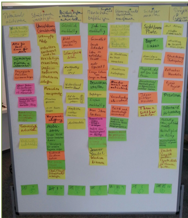
Abbildung 3: Ergebnis des Verstetigungsworkshops

indem Politiker*innen die Möglichkeit hatten untereinander oder mit Bürger*innen ins Gespräch zu kommen, erarbeitet und später auch umgesetzt.