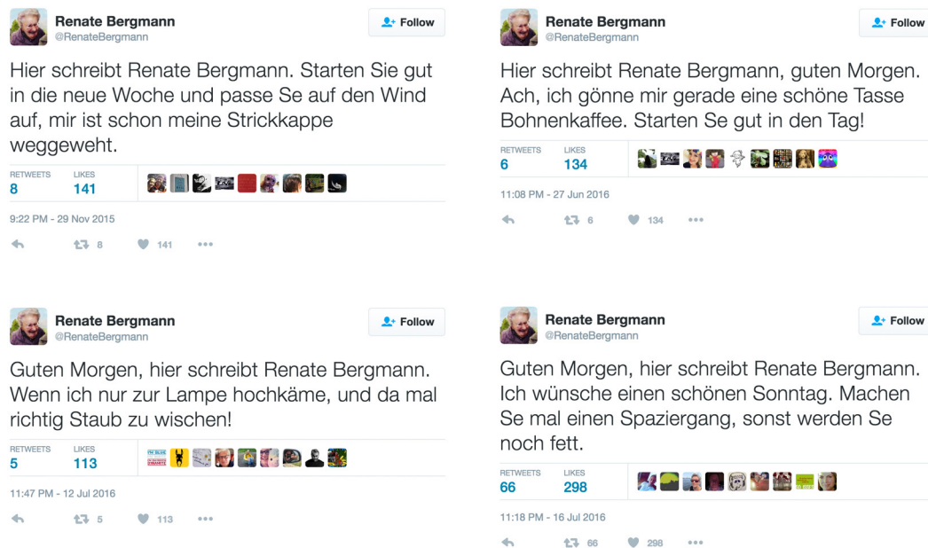
Abb. 1: Verschiedene Tweets aus dem Zeitraum von November 2015 bis Juli 2016 mit dem Satz »[H]ier schreibt Renate Bergmann« (eigene Zusammenstellung)

Rohde nutzt Twitter zum Entwurf einer fiktiven Figur, die selbst als Verantwortliche ihres Accounts auftritt. 33 Die Tweets werden nicht unter dem Namen Torsten Rohde abgesetzt, sondern unter dem Namen Renate Bergmann, die damit als Erzählinstanz markiert wird. Gleichzeitig erzeugt Rohde durch diese Strategie Authentizitätseffekte und spielt mit der Grenze zwischen Fakt und Fiktion. Dennoch wird bei genauerem Hinsehen schnell deutlich, dass es sich bei @RenateBergmann um einen fiktionalen Account handelt. Bei dieser Form der Rollenprosa ist entscheidend, in der potentiell unendlichen – und eben nicht nur 140 Zeichen langen – Erzählung auf Twitter durch verschiedene Strategien das Bild einer kohärenten Persönlichkeit zu erzeugen. Zentrale Mittel für diesen Entwurf einer Figur sind beispielsweise die Etablierung eines festen Kreises von Nebenfiguren wie dem befreundeten Paar Ilse und Kurt und der Tochter Kirsten und dem wiederholenden Bezug auf stets ähnliche Alltagshandlungen wie Blumengießen, Einkaufen, Kochen oder Fernsehen. 34