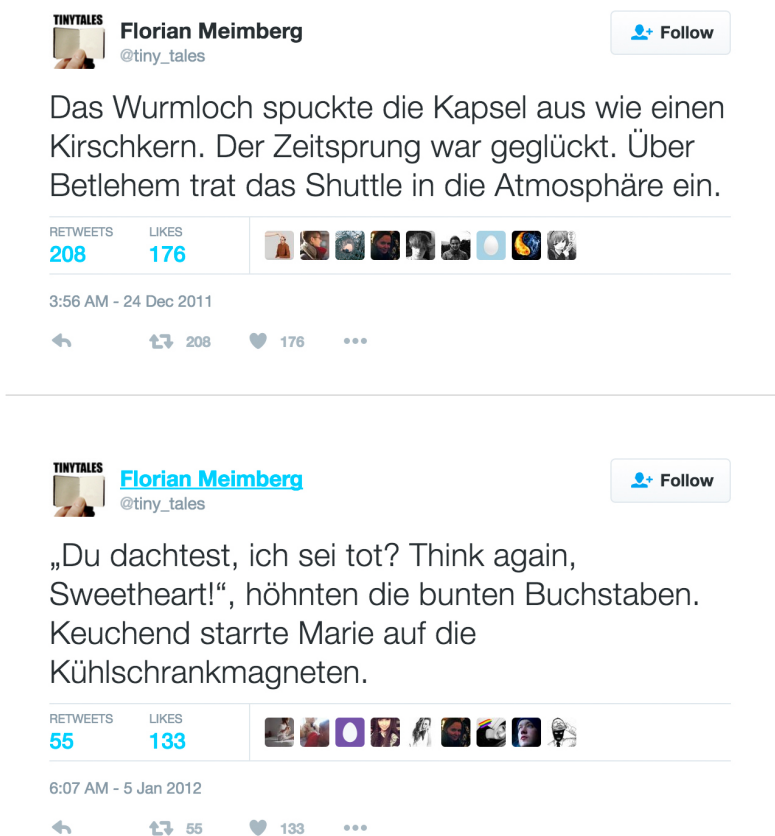
Abb. 2: Tweets des Accounts @tiny_tales (eigene Zusammenstellung)

Wesentlich prekärer erscheinen die Schreibszenen in Florian Meimbergs Tiny Tales . Meimberg publizierte von Oktober 2009 bis Januar 2012 Kürzestgeschichten auf Twitter. Sie begrenzen sich tatsächlich auf den Raum von 140 Zeichen, stehen also in der Tradition der Kürzestgeschichte. 2011 erscheint eine Auswahl der Geschichten unter dem Titel Auf die Länge kommt es an. TINY TALES. Sehr kurze Geschichten auch in Buchform. 36 Einige Kürzestgeschichten aus dem Buch, das thematisch und nicht chronologisch geordnet ist, finden sich auch online beim Account @tiny_tales, einige sind nur in Buchform publiziert worden, weitere nur auf Twitter. Meimberg erhielt für seine Kürzestgeschichten im Jahr 2010 den Grimme Online Award in der Kategorie Spezial. 37 Unter anderem aufgrund dieses Preises war er der erste deutschsprachige Autor, der für auf Twitter veröffentlichte Texte größere Aufmerksamkeit erhielt.