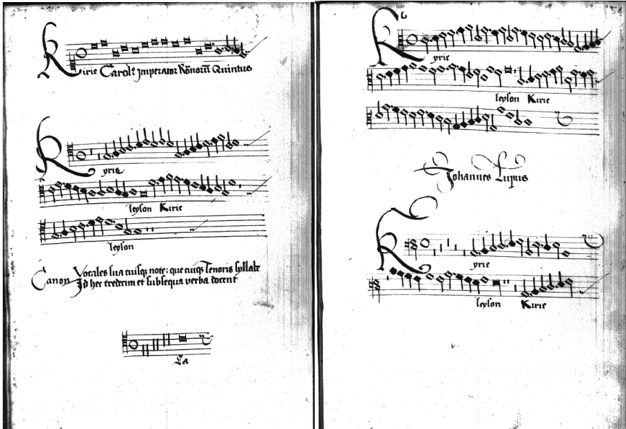
Lupus Hellinck, Missa Carolus Imperator Romanorum quintus, Kyrie I, Mus. Ms. 69, fol. 50 v –51 r