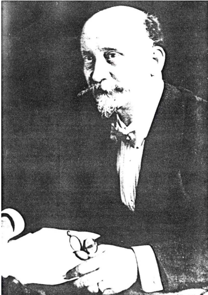
Abbildung 16: Scheidemann als Oberbürgermeister in Kassel, von der Friedrich-Ebert-Stiftung mit der unzutreffenden Amtszeit von 1919 bis 1924 statt von 1920 bis 1925 versehen