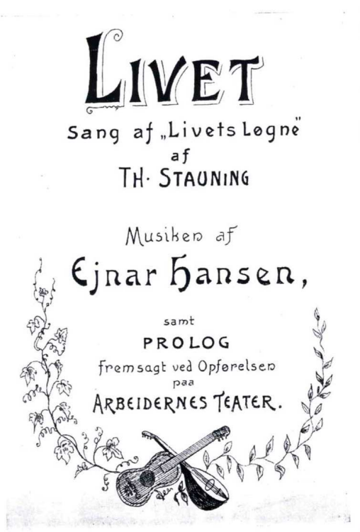
Abbildung 5: Theaterzettel bei einer Aufführung 1904 von Staunings Stück <Livets Løgne>