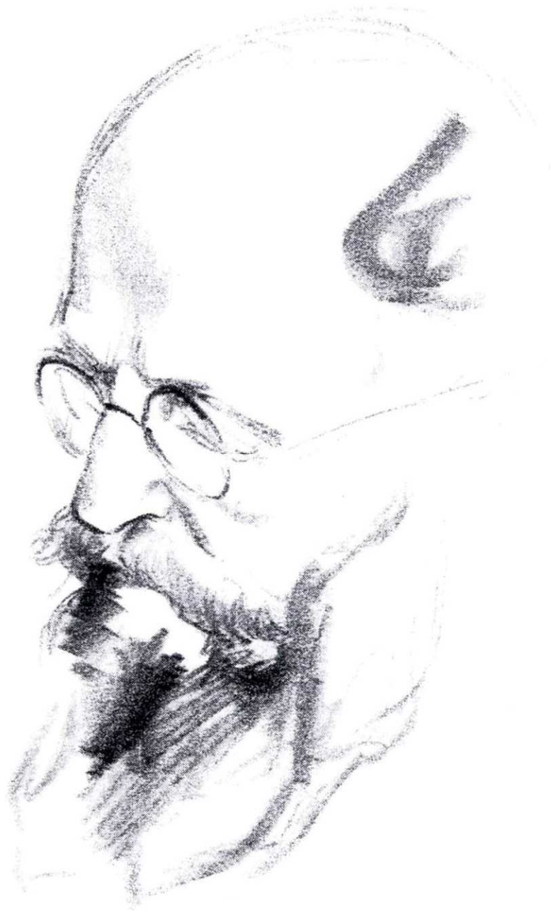
Abbildung 8: Stauning Bildnisse und Karikaturen, Anton Hansens Zeichnung 1935