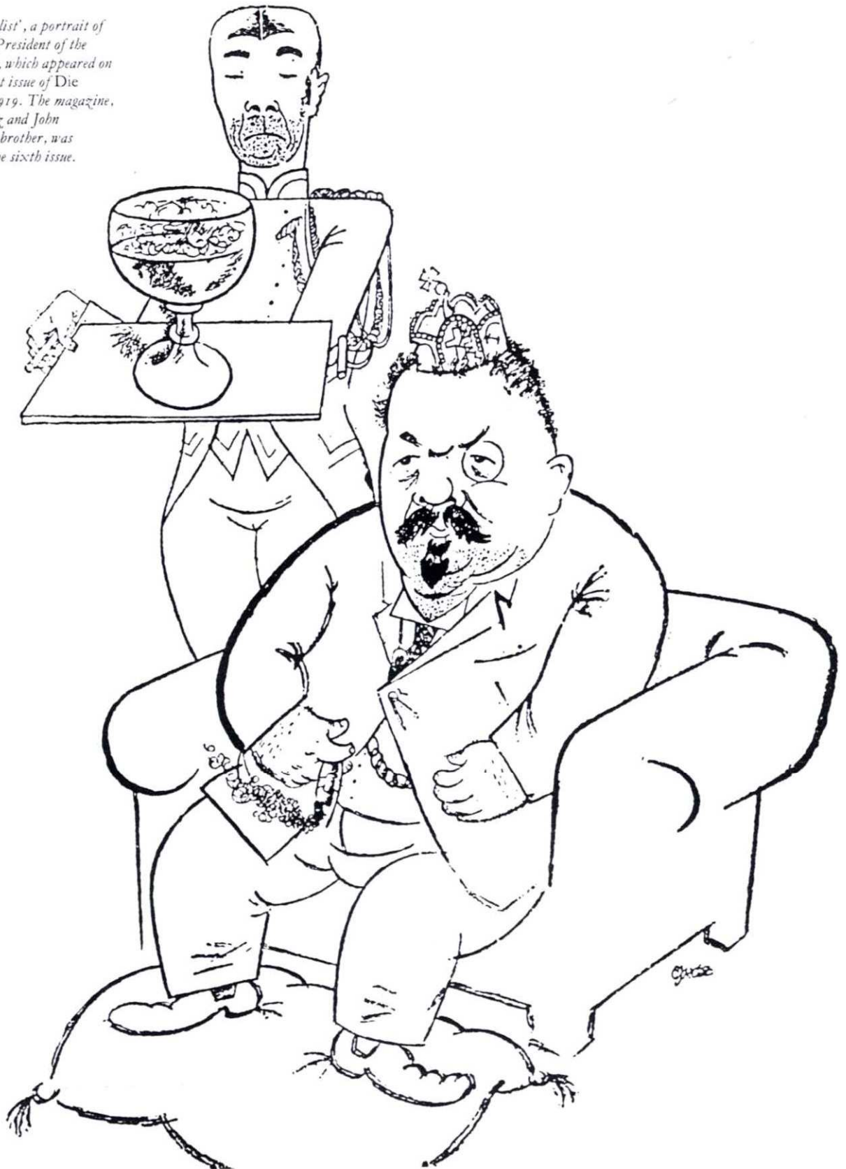
Abbildung 18: Karikatur von ‚König‘ Friedrich Ebert, Die Pleite, März 1919. Diese Zeitschrift von George Grosz und John Heartfield wurde auf Anregung vom Reichspräsidentenbüro von der Berliner Polizei bereits 1920 [sic!] verboten.

'The life of a socialist', a portrait of Friedrich Ebert, President of the Weimar Republic, which appeared on the cover of the first issue of Die Pleite in March 1919. The magazine, published by Grosz and John Heartfield and his brother, was suppressed after the sixth issue.