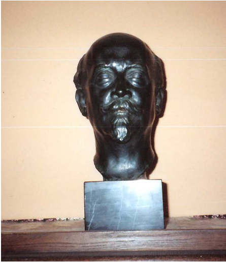
Abbildung 10: Kleinbronze Scheidemanns auf einem Marmorsockel von 1917