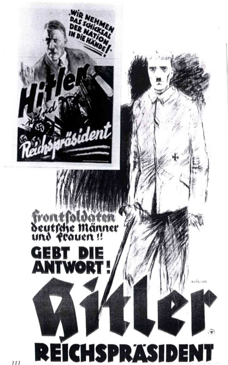
Abbildung 17: NSDAP Plakat für „Hitler als Reichspräsident“ 1932.