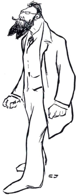
Forste Karikatur af Folketingsmand Stauning 1906 — 07.