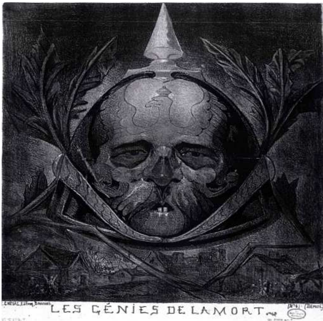
Abbildung 13: Belgische satirische Bismarck Karikatur von 1870 génie de la mort Der ‚Untergrund‘ spricht für sich selbst. Alle deutschen und alliierten Witzblätter schalteten 1914 auf derartige Propaganda gegen den Feind um. 1913 hatte es der Reichstag noch abgelehnt, dem Kriegsministerium ein eigenes Pressebüro einzuräumen.