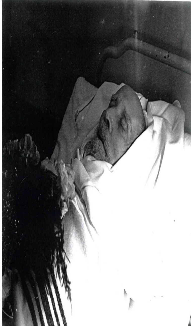
Abbildung 1: Philipp Scheidemann auf dem Totenbett am 3. Dezember 1939 in Kopenhagen.