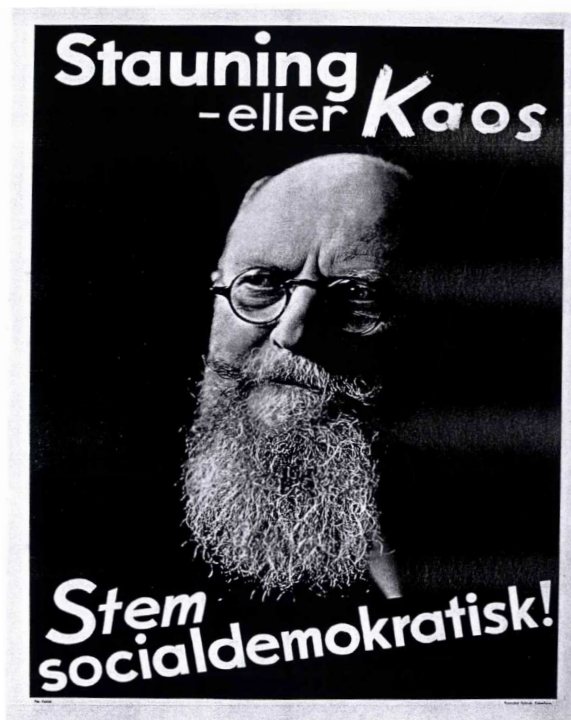
Abbildung 7: Stauning Bildnisse und Karikaturen, „Stauning - eller Kaos Stem socialdemokratisk!“ 1935