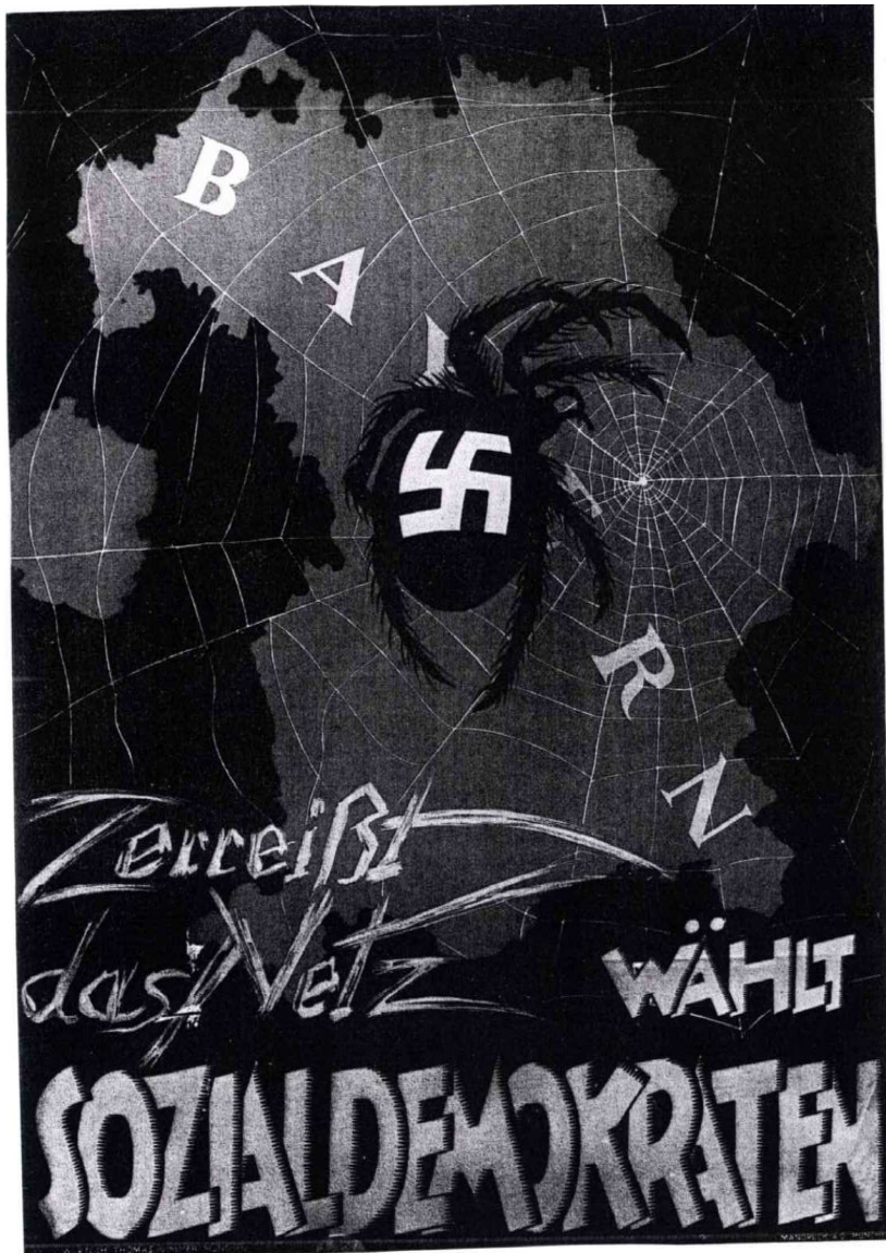
Abbildung 21: „Zerreit das Netz: whlt Sozialdemokraten“ Mnchen wahrscheinlich 1919.