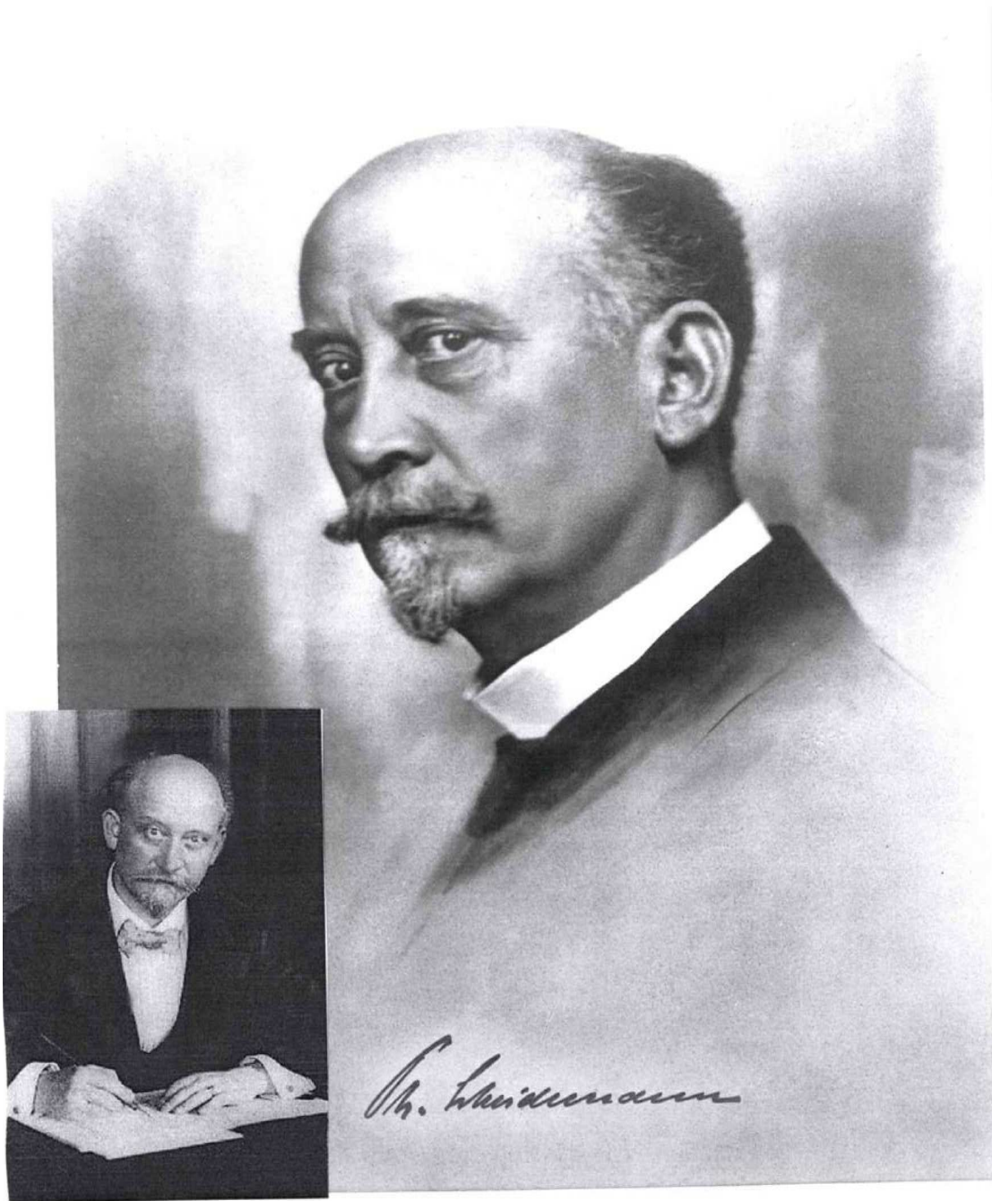
Abbildung 15: Scheidemann als Kanzler (nicht identifizierte Atelieraufnahme 1919) und in seinem Büro bei der Arbeit 1919