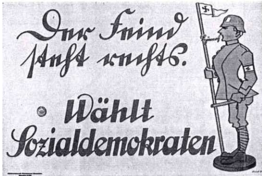
Abbildung 12: „Der Feind steht rechts!“ München wahrscheinlich 1919