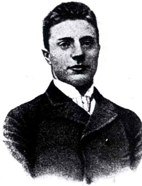
Stauning 19 Aar gammel.