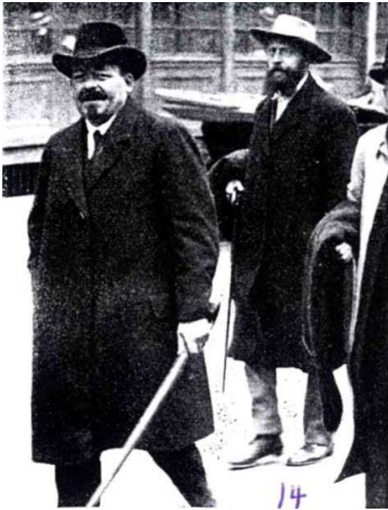
Abbildung 19: Ebert mit Stauning bei der Friedenskonferenz von Stockholm 1917