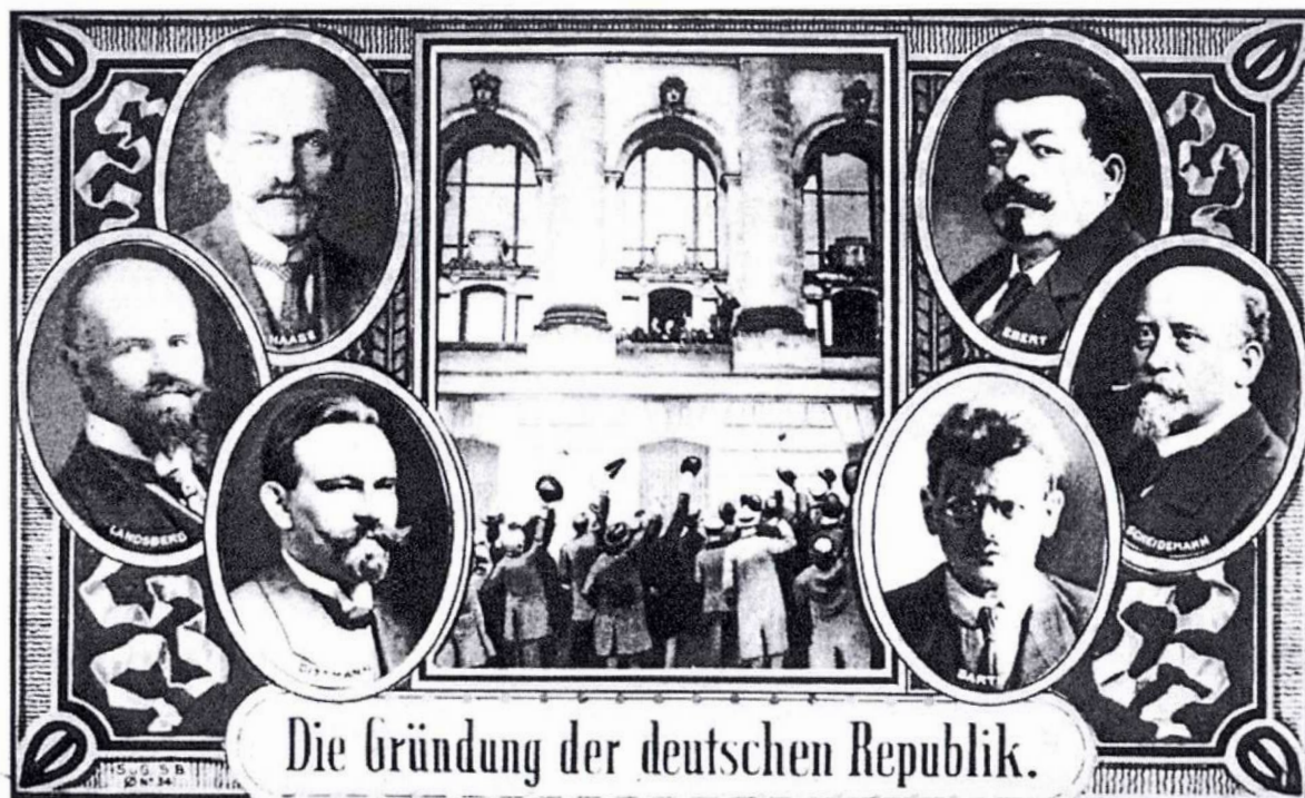
9. November 1918: Deutschland wird Republik (Abb.: Fotomontage zum Rat der Volksbeauftragten)